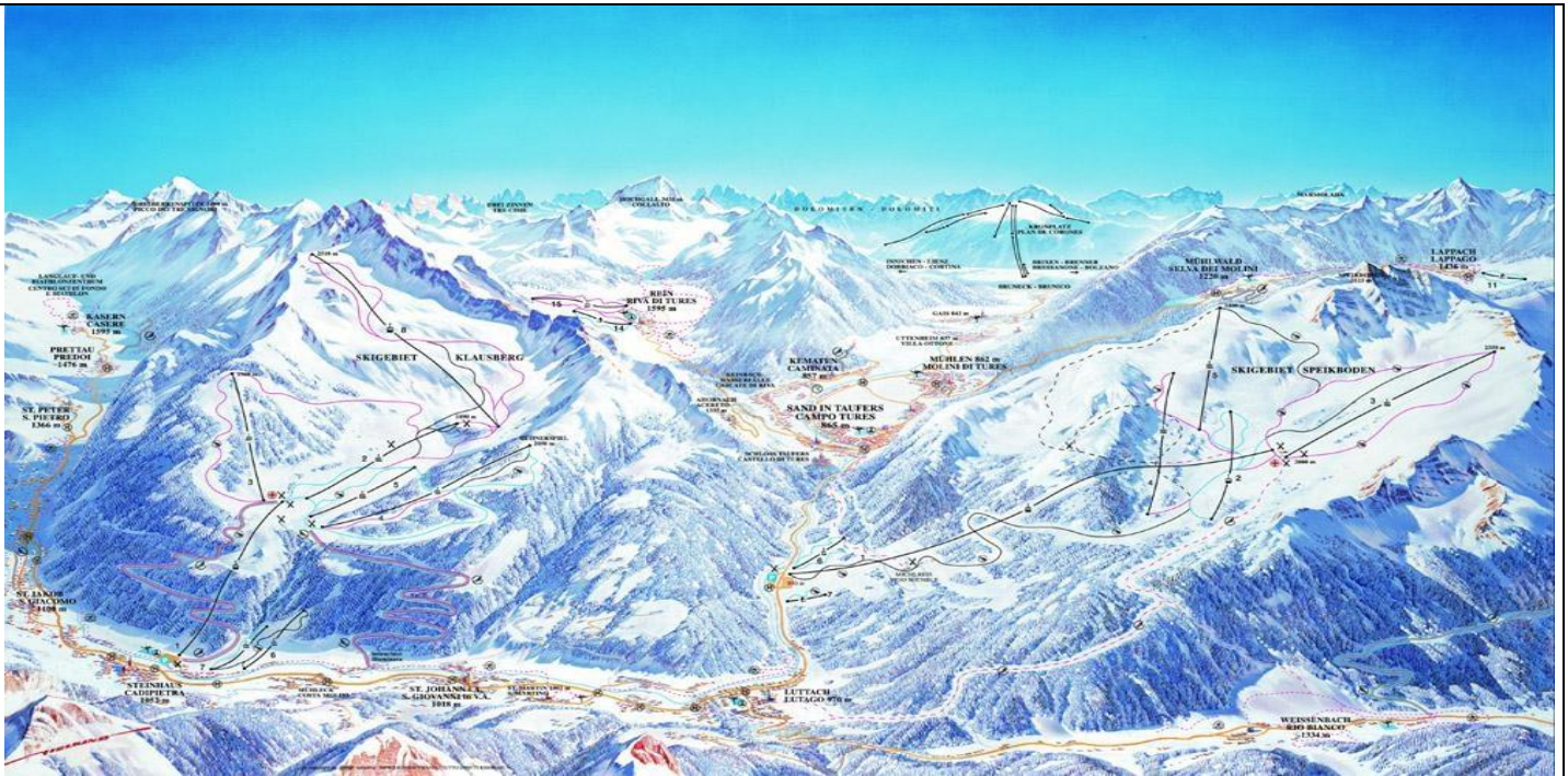
Skigebiet Ahrntal (- 2.500m): Infos unter: www.ahmtal.com

Südtirol ist die nördlichste Provinz Italiens und grenzt an Österreich und an die Schweiz. Auf die Sonnenseite der Alpen gelegen, besticht Südtirol durch sein mediterranes Klima . Die Sonne strahlt hier öfter und länger als sonst irgendwo in den Alpen. Dem Winterurlauber erwarten hier zahlreiche Möglichkeiten für alle Ansprüche . Vom anspruchsvollen Skifahrer und Snowboarder bis zum gemütlichen Langläufer – jeder kommt hier auf seine Kosten in einem von den zwei Skigebieten .